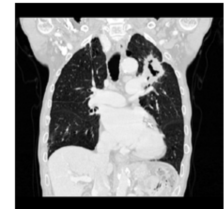
Bronchialkarzinom des linken Oberlappens durch VATS-Lobektomie thorakoskopisch entfernt