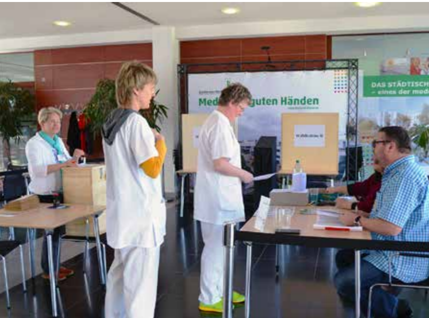
Am 29. April 2015 fand im Städtischen Klinikum Dessau die Personalratswahl statt.