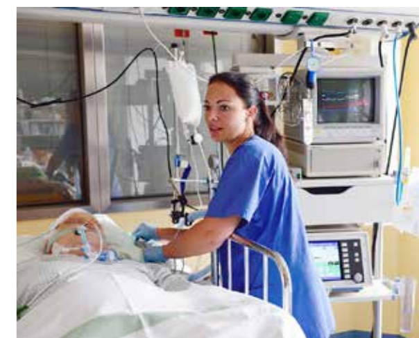
Die Arbeit auf Intensivstationen erfordert weitaus mehr als die Beherrschung der High-Tech-Apparate. Das Städtische Klinikum Dessau bietet eine berufsbegleitende Fachweiterbildung für Pflegekräfte an.

Kontakt und Anmeldung: Akademie für Bildung und Information des Städtischen Klinikums Dessau, Krankenpflegeschule, Leiterin: Dipl. Päd. Ute Busch (ute.busch@klinikum-dessau.de) Telefon: 0340 501-1830, Fax: 0340 501-1832, krankenpflegeschule@klinikum-dessau.de, www.klinikum-dessau.de