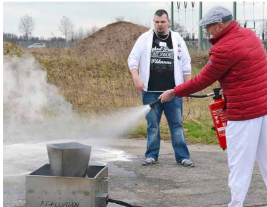
Löschen bis der Arzt kommt? Nein, beim Feuerlöschertraining werden Ärzte, Schwestern und Verwaltungspersonal präventiv tätig. Sie greifen zu den verschiedenen Feuerlöschern und üben die Brandbekämpfung unter fachkundiger Anleitung.